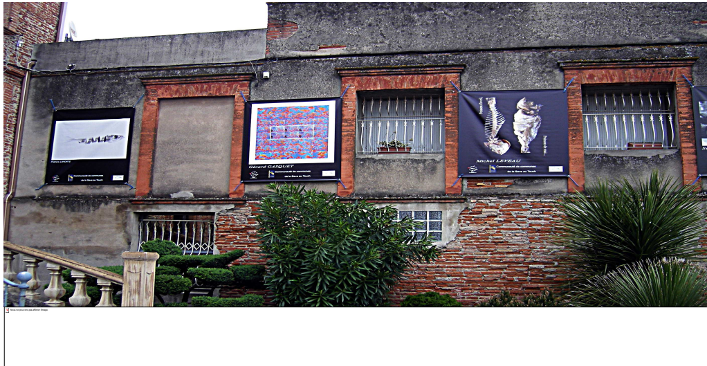
Un ensemble de bâches.